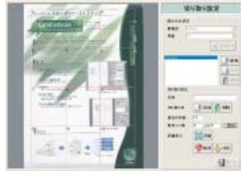
切り取り設定登録画面