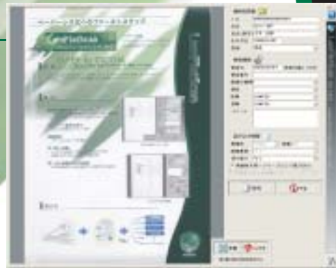
取り込み画像プレビュー表示

※Modality Worklist Management (MWM)と呼ばれることもあります。