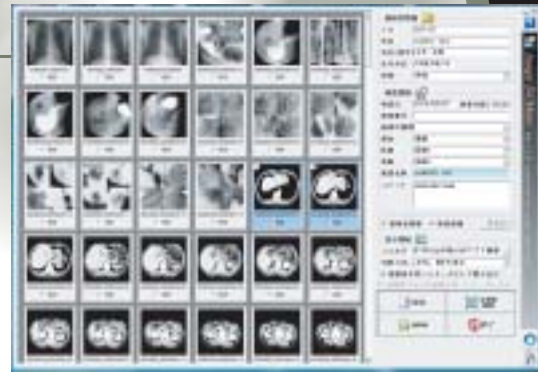
変換予定画像一覧表示