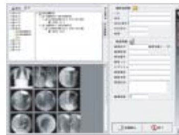
DICOMDIR読み込みシステム

構成図 保存、読み込みプログラムをあわせて使用することで、保存メディアの管理を行うことができます。