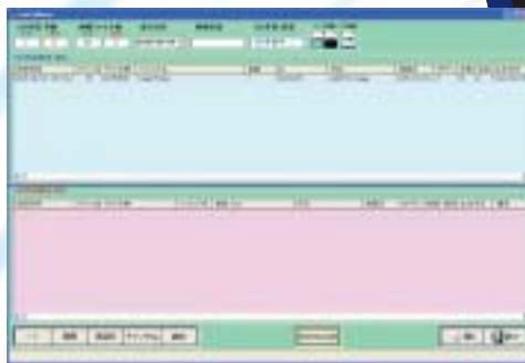
PDIメディア作成画面