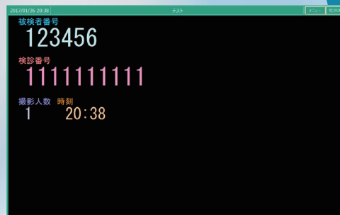
被検者情報表示画面