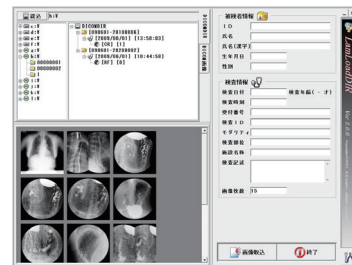
DICOMDIR読み込みシステム

構成図 保存、取り込みソフトウェアをあわせて使用することで、保存メディアの管理を行うことができます。